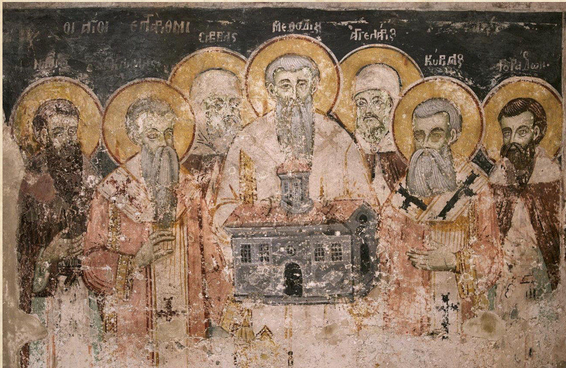
Святые Кирилл и Мефодий с учениками. Фреска монастыря.

Сегодня День славянской письменности и культуры – единственный праздник в РФ, который соединяет в себе светские и религиозные мероприятия.